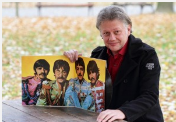
„Bitlsi”: Ringo, Džon, Pol, Džordž i Ivan; Foto A. Stojković

gramofonske ploče carovale i bile od životne važnosti, a takođe i o tome kako su se, kasnije, i životi i ploče davali u bescenje.