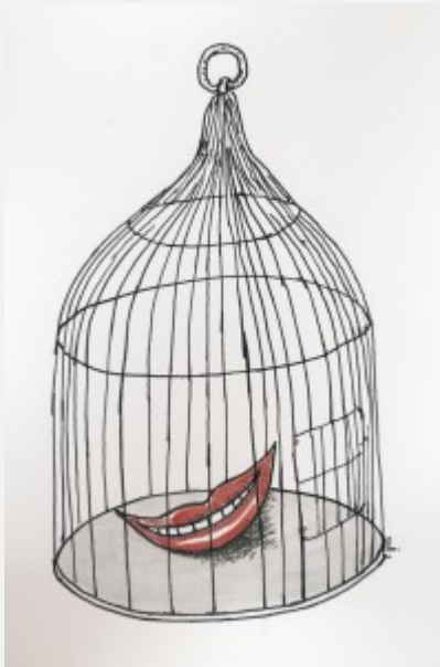
Ilustracija Dušan Ludvig

Do pre dan-dva malo ko je znao šta znači reč „dron“, a dovoljno je bilo da se dogodi pokušaj odigravanja fudbalskog meča između Srbije i Albanije, pa da svi sve o dronu saznamo. Hajde da probamo da skockamo rasulo ostalo iza odrona poruka skotrljanih u javnost od lansiranja drona, tj. u poslednja 24 sata.