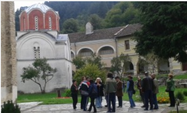
Studenica – gimnazijski „tim-bilding”

Tridesetak profesorki, profesora i zaposlenih u stručnim i pomoćnim službama Gimnazije „Uroš Predić” provelo je vikend zajedno, na ekskurziji u Ivanjici. U okviru svojevrsnog „tim-bildinga” oni su u subotu, 27. septembra, posetili Studenicu, a sutradan i manastire u okolini Čačka.