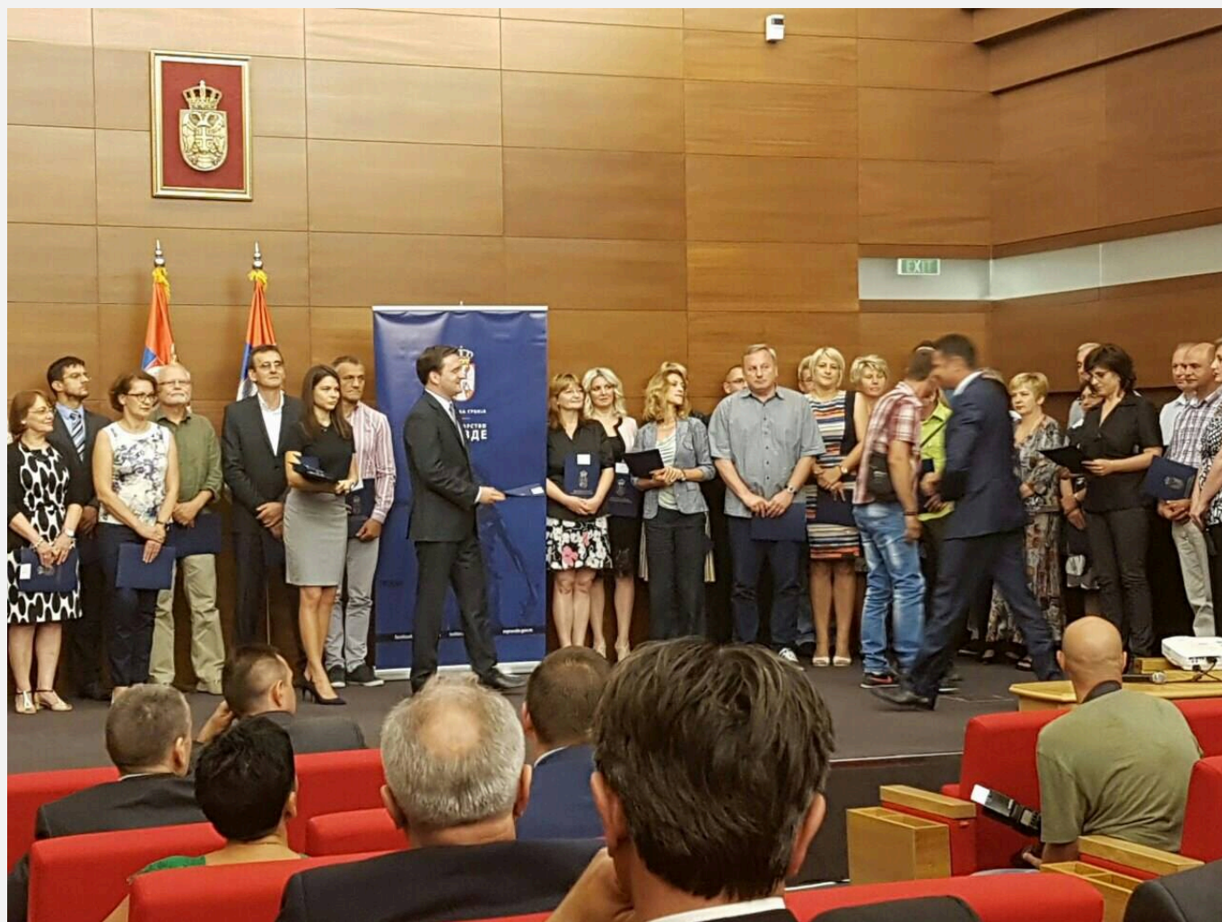
Potpisivanje ugovora u Klubu poslanika

se predviđa kupovina vozila za prevoz pacijenata kojima je potrebna ta terapija. Ugovor između Ministarstva pravde i Doma zdravlja svečano je potpisan u sredu, 6. jula, u Klubu poslanika u Beogradu.