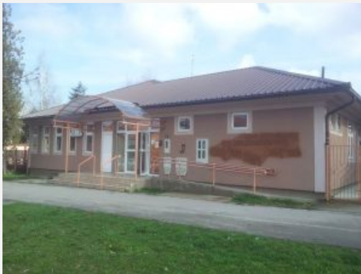
Ambulanta „Gornji grad”

Povodom Svetskog dana borbe protiv raka, 4. februara, Dom zdravlja Pančevo će u ponedeljak, 6. februara, od 8 do 10 sati , u Zdravstvenoj ambulanti „Gornji grad” (Ulica Svetog Save 88) sprovesti akciju besplatnih preventivnih pregleda za sve zainteresovane građane.